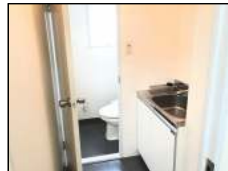
給湯室・トイレ部分