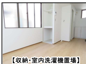
【収納・室内洗濯機置場】