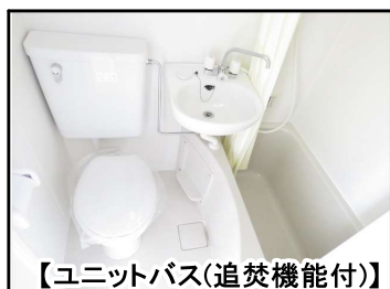
【ユニットバス(追焚機能付)】