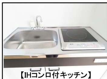
【IHコンロ付キッチン】