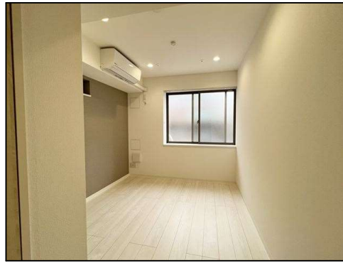
【同仕様の洋室部分】

※無料インターネットは共有のwifi環境のため場所や時間帯によって使用できない場合があります。※図面と現況が異なる場合は現況優先とします。※本物件は禁煙です。