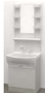
※画像はイメージです。独立洗面台は304を除く。

シンプルな操作のシングルレバー水栓。泡沫ストリートは少ない吐水量でも同量のシャワー効果を得られる節水効果があります。リフトアップ機能やフタタッチ切替も付いていて、いろんな家事に使える親切設計。