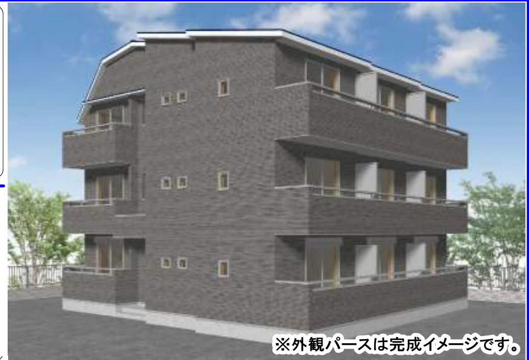
※外観パースは完成イメージです。