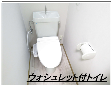
ウォシュレット付トイレ